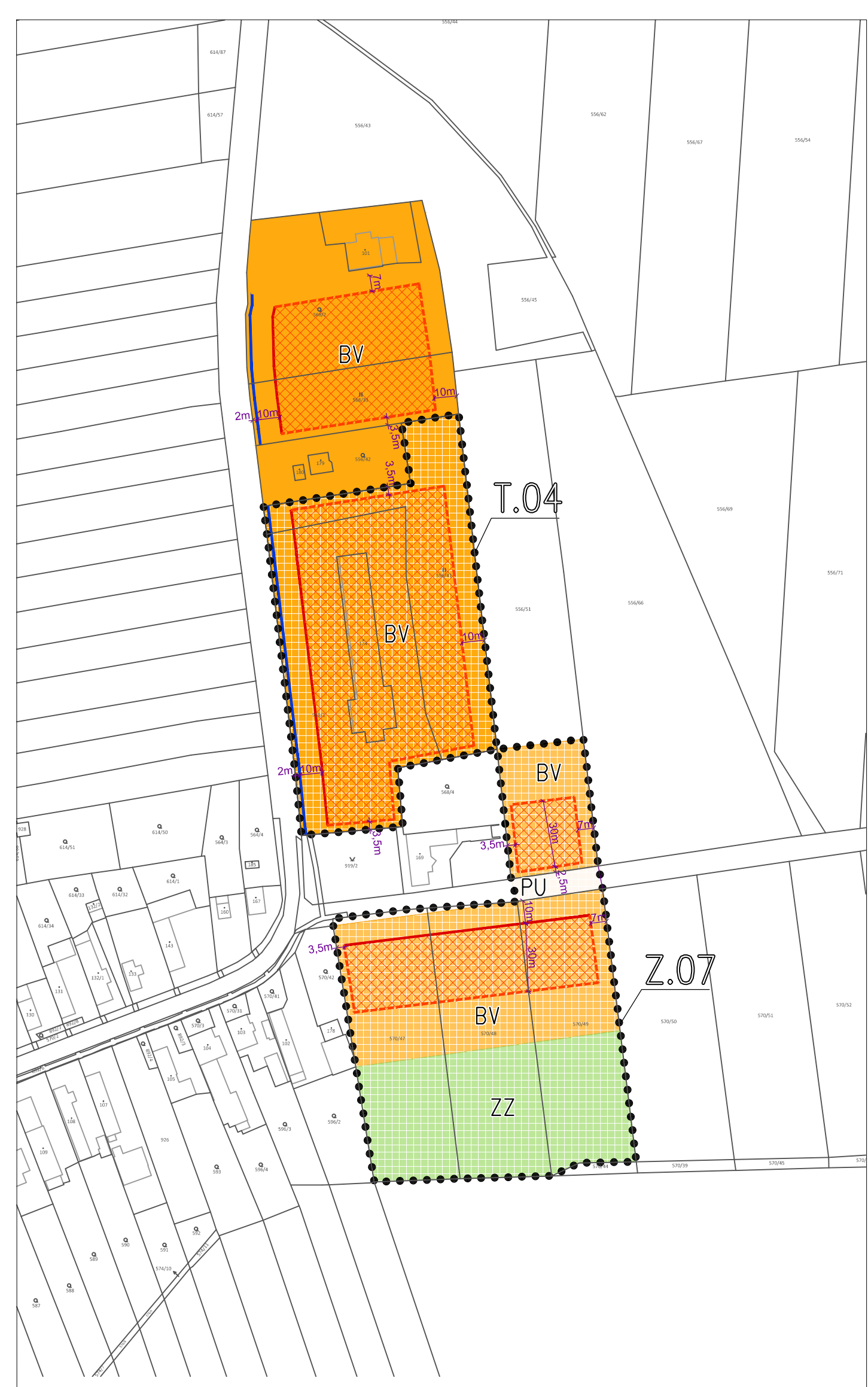
ČÁSTI ÚP (PLOCHY) S PRVKY REGULAČNÍHO PLÁNU - U.01 a U.02 M 1 : 2000